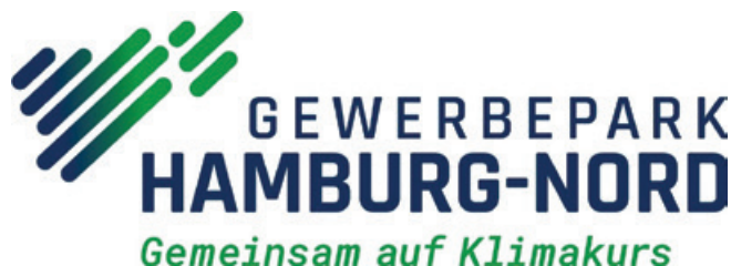
Logo Gewerbepark Hamburg-Nord

Bei Vernetzungstreffen haben die Unternehmen untereinander und mit anderen Akteur:innen aus dem Bereich Klimaschutz die Möglichkeit, in Diskurs über bereits gelungene und zukünftige Projekte zu treten. Die Idee dabei ist, voneinander zu lernen und möglicherweise bis dato unbekannte Synergien zu entdecken. Gemeinsam mit teilnehmenden Unternehmen unterstützt die Wirtschaftsförderung und das Klimaschutzmanagement des Bezirks Nord den Aufbau des Klimaschutznetzwerks. Eine Auflistung der teilnehmenden Unternehmen finden Sie auf der Internetseite des Bezirksamts Nord. Wenn Sie die Entwicklung dieses Pilotprojekts interessiert, können Sie dort auch erfahren, was die einzelnen Unternehmen schon im Bereich Klimaschutz unternommen haben und sich für laufende Neuigkeiten zum Projekt für den Newsletter anmelden. Text: Julius Wettwer