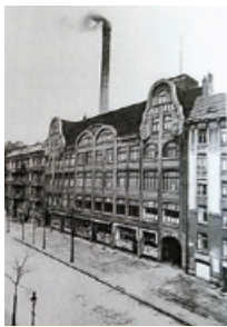
K. Tornier, Hamburg- Hoheluft: der Jahrhundert- Stadtteil, 2013

1896 traten die Hafendarbeiter in Streik. Nach 11 Wochen gaben sie auf – die Gewerkschaft hatte damals noch keinen Hilfsfonds und die gesammelten Spenden reichten nicht aus, um die Familien zu ernähren. Vor diesem Hintergrund wurde im Januar 1899 mit gewerkschaftlicher Unterstützung der Konsum-, Bau- und Sparverein „Produktion“ gegründet. Das Projekt wurde ein riesiger Erfolg! 10 Jahre später zählte die Genossenschaft bereits 47000 Mitglieder und es gab mehr als 60 Läden, in denen die Produkte aus