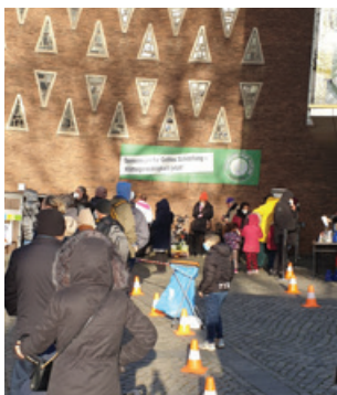
Ausgabestelle der Hamburger Tafel in Harvestehude

Unter vielen Hamburgern gilt Eppendorf als reicher Stadtteil. Teure Wohnungen, gut verdienende Einwohner und Shopping-Erlebnisse der gehobenen Art prägen das allgemeine Bild. Dass aber durch die hohen Energiekosten und die historisch hohe Inflation von 10 Prozent immer mehr Armut auch in diesem Stadtteil Einzug erhält, merkt auch die Ausgabestelle der Hamburger Tafel