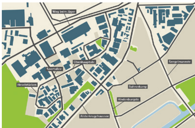
Karte Unternehmen Gewerbepark Hamburg-Nord Klima

Der Bezirk Hamburg-Nord setzt immer häufiger auf klimafreundliche Projekte und Kooperationen. So auch am Beispiel des Pilotprojekts „Gewerbepark Hamburg-Nord, gemeinsam auf Klimakurs“. Wie das Motto der Initiative vermuten lässt, handelt es sich hierbei um ein gemeinschaftliches Projekt auf dem Gelände des Gewerbepark Hamburg-Nord von über 20 Unternehmen und dem Bezirksamt Nord. Ziel ist, durch Zusammenarbeit, gegenseitige Unterstützung und Vernetzung zwischen den ansässigen Unternehmen, diesen Standort zum klimafreundlichsten Gewerbegebiet im Norden Hamburgs zu machen. Die selbstgesetzten Verpflichtungen beinhalten, sich mit mindestens einer der folgenden Kategorien auseinanderzusetzen und Innovationen in diesen Bereichen umzusetzen: Energie, Ressourcenschonung, betriebliche Mobilität und Klimaanpassung.