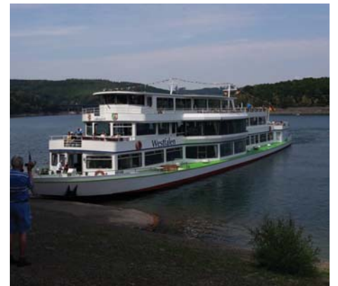
Schiffahrt auf dem Biggensee