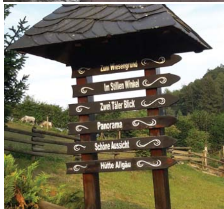
Park der Stille