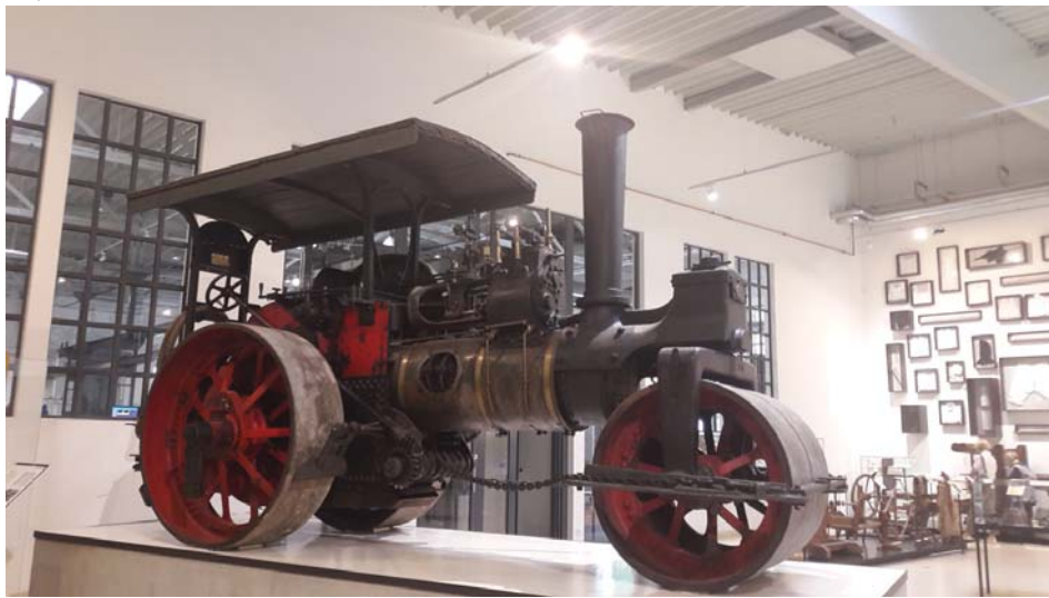
Dampf, Land, Leute