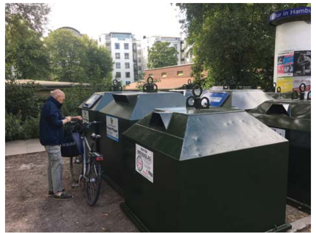
Rentner Neuldorf nutzt schon den frisch eingerichteten Container-Stellplatz

chen, zumal es nicht wirklich viele Sammelstellen im Stadtteil gibt. Natürlich möchte kein Anwohner das laute Geräusch vom Glas scheppern direkt vor seinem Wohn- oder Schlafzimmerfenster haben. Andererseits steht zu befürchten, dass größere Entfernungen mit viel Recyclinggut dann gerne mit dem PKW weggebracht werden. Gut für den Materialkreislauf, fragwürdig für die Umweltbilanz insgesamt. Dieses Dilemma zeigt sich in ähnlicher Weise auch für die Weiterverwertung von Altkleidern. Da die Stadtreinigung angekündigt hat, diese Container gänzlich aufzugeben, bleibt auch hier nur der längere und beschwerliche Weg zum Recyclinghof. Oder bei vielen die bequeme Variante Richtung Hausmüll. Wenn man Trapattonis