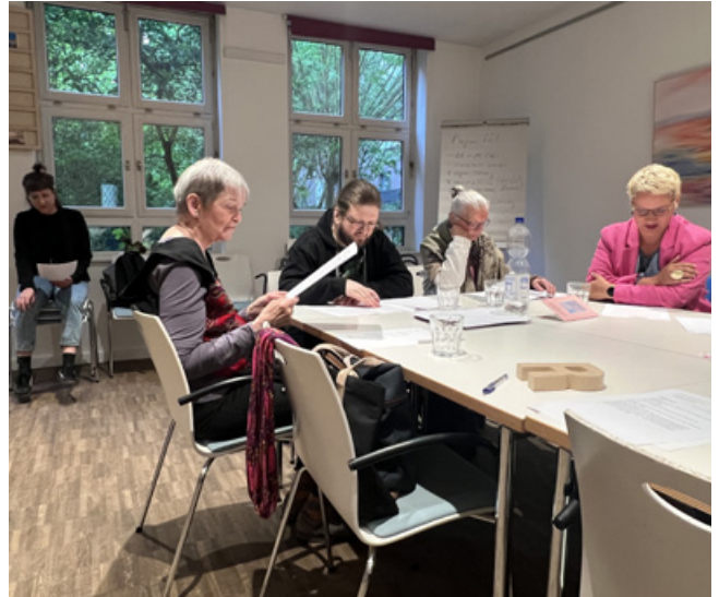
Foto: Frau Chmelik und die Autoren der Schreibwerkstatt Eppe & Flut