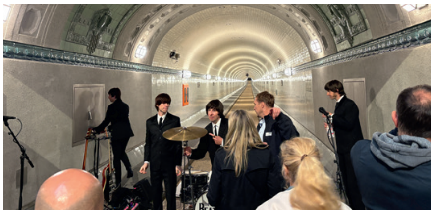
Blick in die Weströhre mit Beatles Coverband