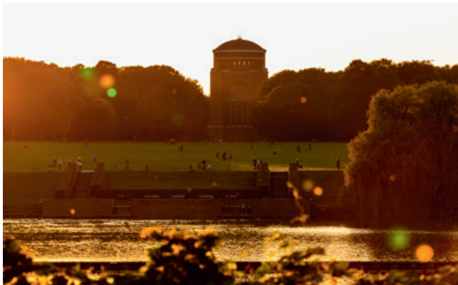
Trügerische Idylle – im Stadtpark kann es in den Abendstunden gefährlich werden

Der Stadtpark – eine Idylle, die aus einer gelungenen Mischung von Natur, Erholung, kulturellem Leben und Begegnungen entsteht. Ein Rückzugsort zum Abschalten, Genießen, Feiern und Zusammenkommen und eine