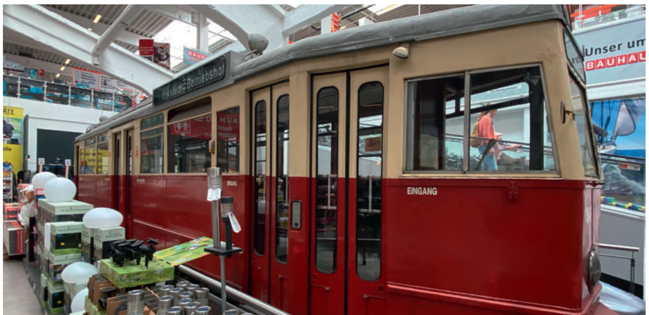
Triebwagen Typ „V6“

Highlight wird hier die historische „Endhaltstelle Ohlsdorf“ als Hingucker sein, die vollständig erhalten ist und von Ohlsdorf hierher verlegt wird (siehe Bild). Die Kosten für den Bau sind insgesamt überschaubar, da u.a. in Eppendorf noch zahlreiche Oberleitungsrosetten an den alten Gebäuden zu finden sind, die wieder genutzt werden können. Außerdem wurden die im Straßenpflaster eingebetteten Straßenbahngleise in der Regel aus Kostengründen lediglich mit einer neuen Fahrbahndecke überbaut. Auch diese können schnell reaktiviert werden. Hinzu kommt, zum Glück der Straßenbahn-Nostalgiker, dass sogar die Original-Triebwagen (z.B. Typ „V6“) auf der Rundlinie fahren werden, da einige Triebwagen noch fast vollständig und intakt sind. Eppendorf hätte somit eine Sehenswürdigkeit und eine umweltfreundliche Mobilitätsalternative mehr. Freuen Sie sich auch schon auf die Fahrt mit der historischen Straßenbahn wie wir, liebe Leser:innen?