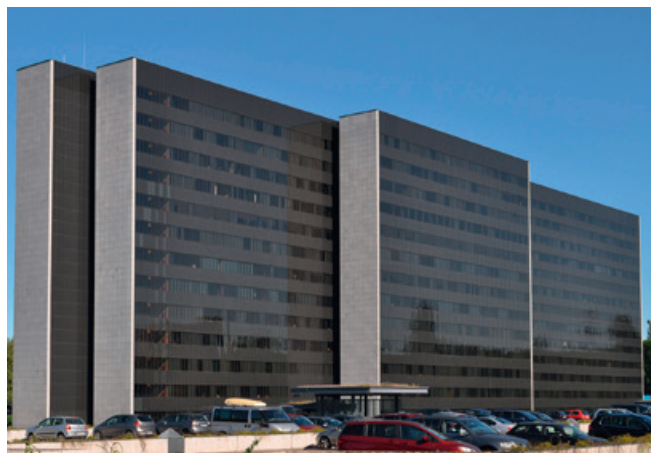
Ein möglicher Standort für das Bezirksamt: Die HEW-Hochhäuser in der City Nord